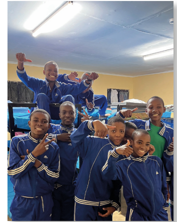
Vanaf nu gaat het licht nooit meer uit op de Mpinda Boys Secondary School in Singida